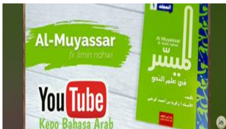
Gambar 3. @kepo bahasa Arab

Youtuber dengan akun @kepo bahasa Arab juga merupakan youtuber yang memiliki jumlah pengikut yang banyak, ada 83,6 rb lebih subscriber pada akun ini.