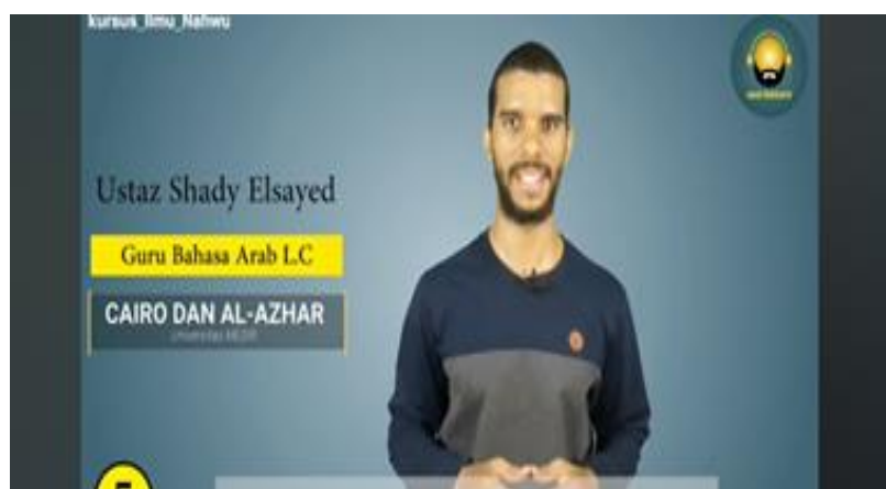
Gambar 1. @Arab podcasts

YouTuber dengan akun @Arab podcasts yang memiliki subscriber 166 rb dan video yang dibagikan sebanyak 471 video. YouTuber ini secara aktif membuat dan membagikan video tentang pembelajaran bahasa Arab. Terdapat beragam kategori yang disediakan dan kategori dengan tingkat keterlibatan tertinggi adalah kategori takallam Arabiyah .