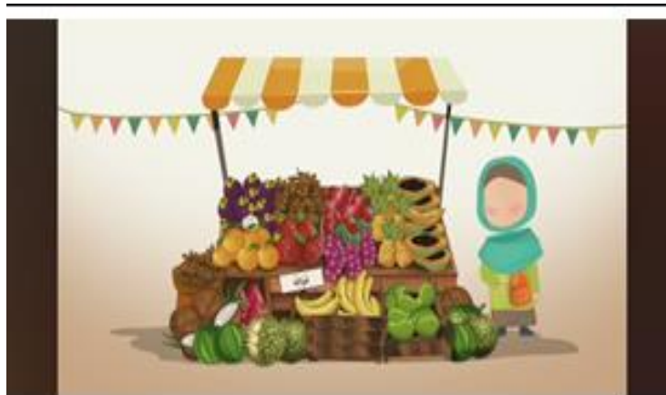
Gambar 2. @Sarah playschool

YouTuber dengan akun @Sarah playschool merupakan salah satu akun yang menyediakan bimbingan belajar bahasa Arab khusus untuk anak-anak. Akun ini memiliki subscriber 104 rb dan video yang dibagikan sebanyak 106 video.